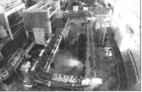
图为“烟台啤酒”现代化的罐装生产线。