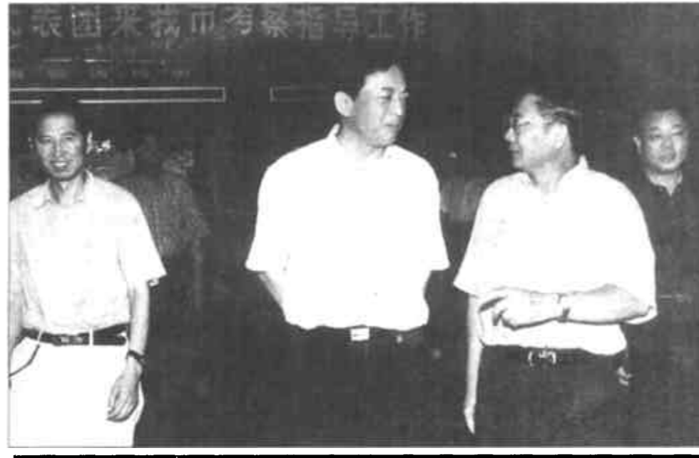
图为市委副书记、市长石军同四川省宜宾市委书记高万权(左二)亲切交谈。