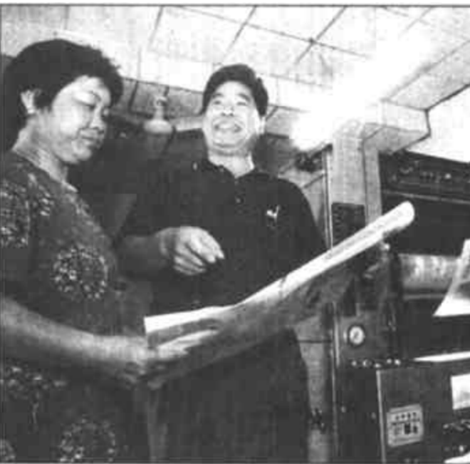
河口管理局政务公开工作始于去年。今年3月，该局在局机关和四个基层单位全面推行了政务公开，并初步建立了党组领导、行政负责、部门承办、纪检监察、工会协调、职工参与的领导体制和工作机制。

为了确保公开的实效性和真实性，该局一是增加了工作透明度，避免了不必要的误会，密切了干群关系。如在去年的机构改革和干部竞争上岗过程中，管理局机关及四个基层局都把上级规定及